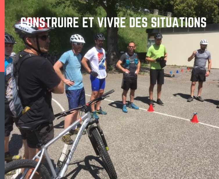
CONSTRUIRE ET VIVRE DES SITUATIONS